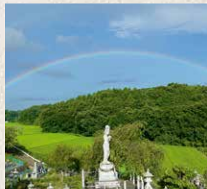
金剛寺の観音さまと虹のかけ橋

本堂は国宝、10mある十一面観音さまは重要文化財で、「わらしべ長者」のお話にも出てくるお寺です。